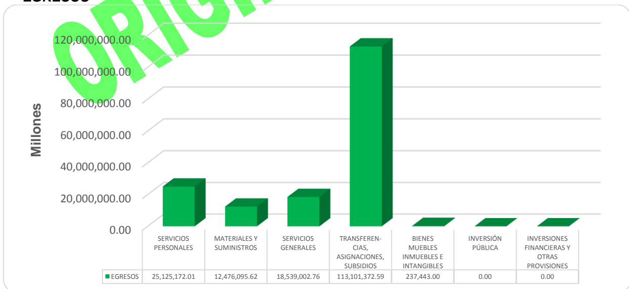
GRÁFICA 2 EGRESOS